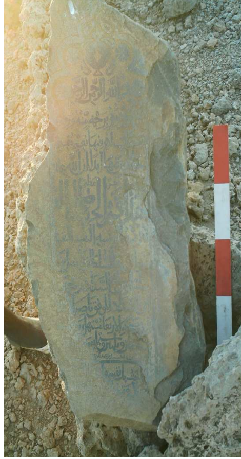
توقيع الكاتب بين السطور