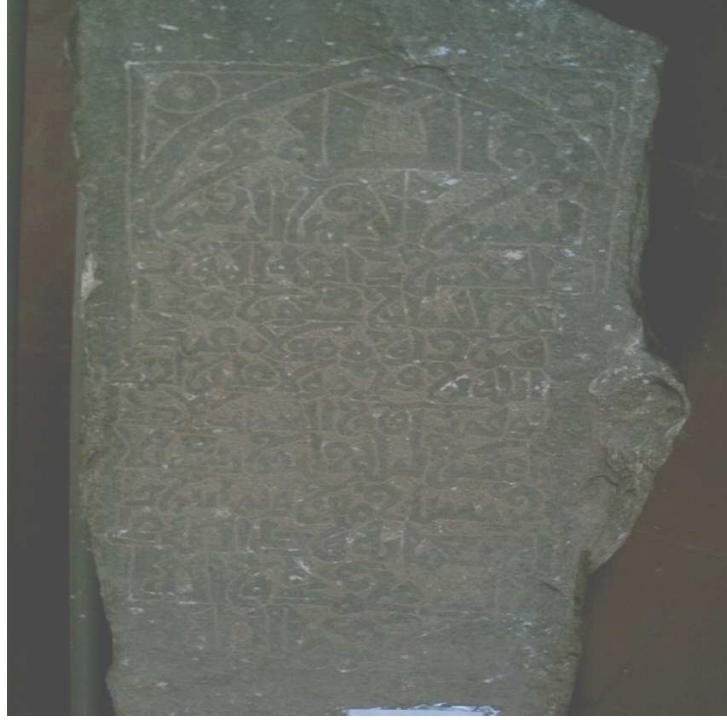
صورة (48) 21 مايو 1092 م ( تصوير الباحث )