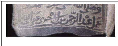
1 / رقم (58) بالمتحف البريطاني AN00346072.