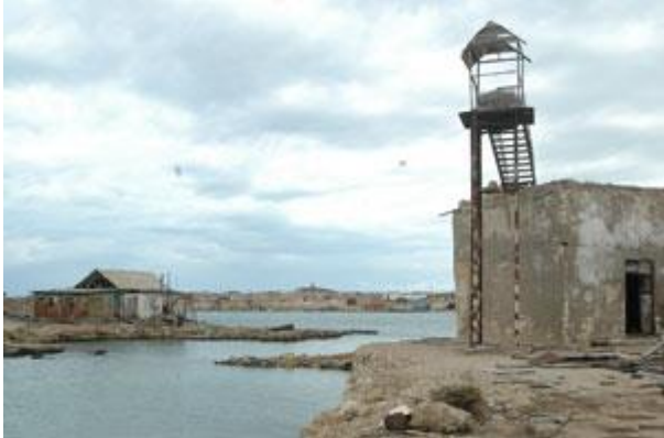
ቤት ማእሰርቲ ደሴት ናኹራ

መሬት ኤርትራ ዝረገጹ ባዕዳውያን ገዛእቲ፡ ካብ ቱርኪ ጀሚርካ፡ ግብጹ፡ ጣልያን፡ እንግሊዝ፡ ግዛኣቶም ንምርጻምን ንምስግዳድን ኣብ ልዕሊ ህዝቢ ኤርትራ ብዙሕ ግፍዒታት ፈጹሞም እዮም። ካብ ወለዶ ናብ ወለዶ እናተመሓላለፈ ዝመጸ’ሞ ክሳብ ሕጂ ዝጥቀስ “ግዛኣት ቱርኪ” ዝብል ሓረግ፡ ንጭካነ ቱርካውያንን ወክልቶም ግብጻውያንን ዘመልክት እዩ። ጣልያንን እንግሊዝን እውን ብተመሳሳሊ ግዛኣቶም ንምውሓስ፡ ዕላማታቱ፡ ዓይነቱ፡ መጠኑን ስፍሓቱን ዝፈላለ ብብዓይነቱ ግፍዒታትን በደላትን ፈጹሞም እዮም። ሓደ ካብቲ ብምስክሕካሕ ዝዝከር ናይ ገዛእቲ ጣልያን ግፍዳዊ ተግባራት፡ እቲ ብርቱዕ መቐት ኣብ ዘለዎ ደሴት ናኹራ፡ ኣብ ትሕቲ መሬት ዝተሃንጸ ቤት ማእሰርቲ እዩ። ኢጣልያውያን ኣብዚ ቤት ማእሰርቲዚ፡ ግዛኣቶም ኣብ ልዕሊ ዝተቐወሙ ሹመኛታትን ዜጋታትን ኤርትራ ጭካነ ዝመልኦ ተግባራት ይፍጽሙ ምንባርም ናይ ሽዑ ስነ-ምግባር ይምስክሩ።